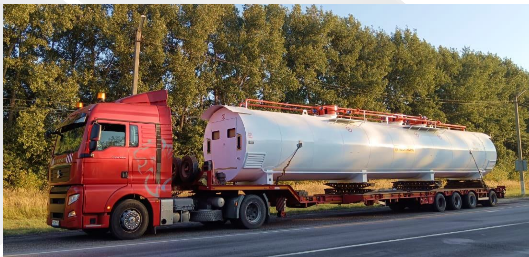
Перевозка мобильных топливозаправочных станций