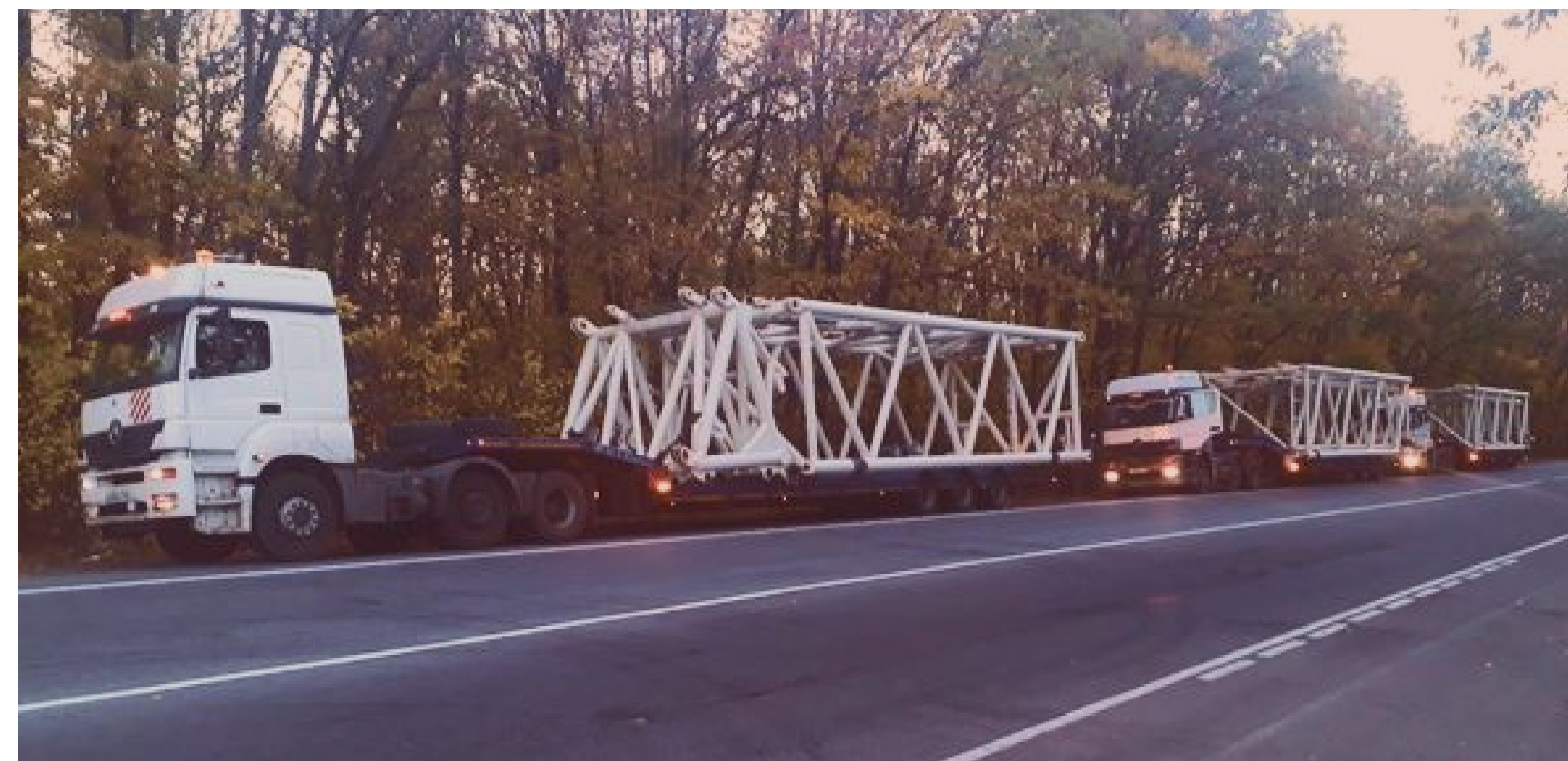
Перевозка башенных кранов