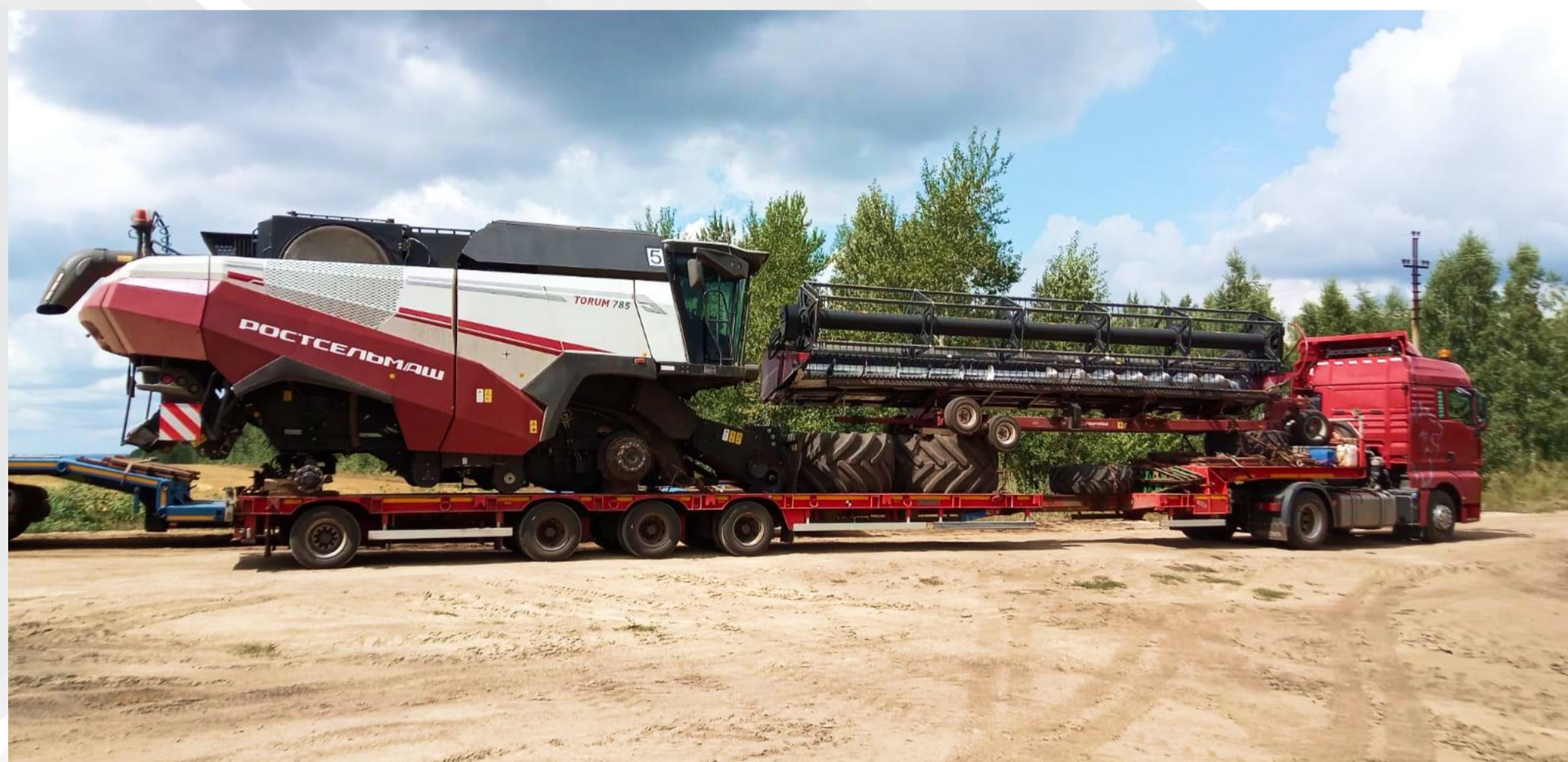
Перевозка зерноуборочных комбайнов с 9-ти метровой жаткой