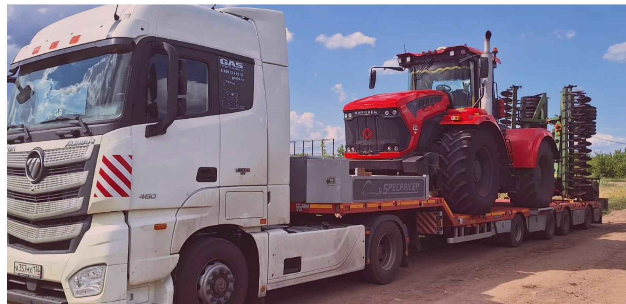
Перевозка тракторов с прицепной техникой