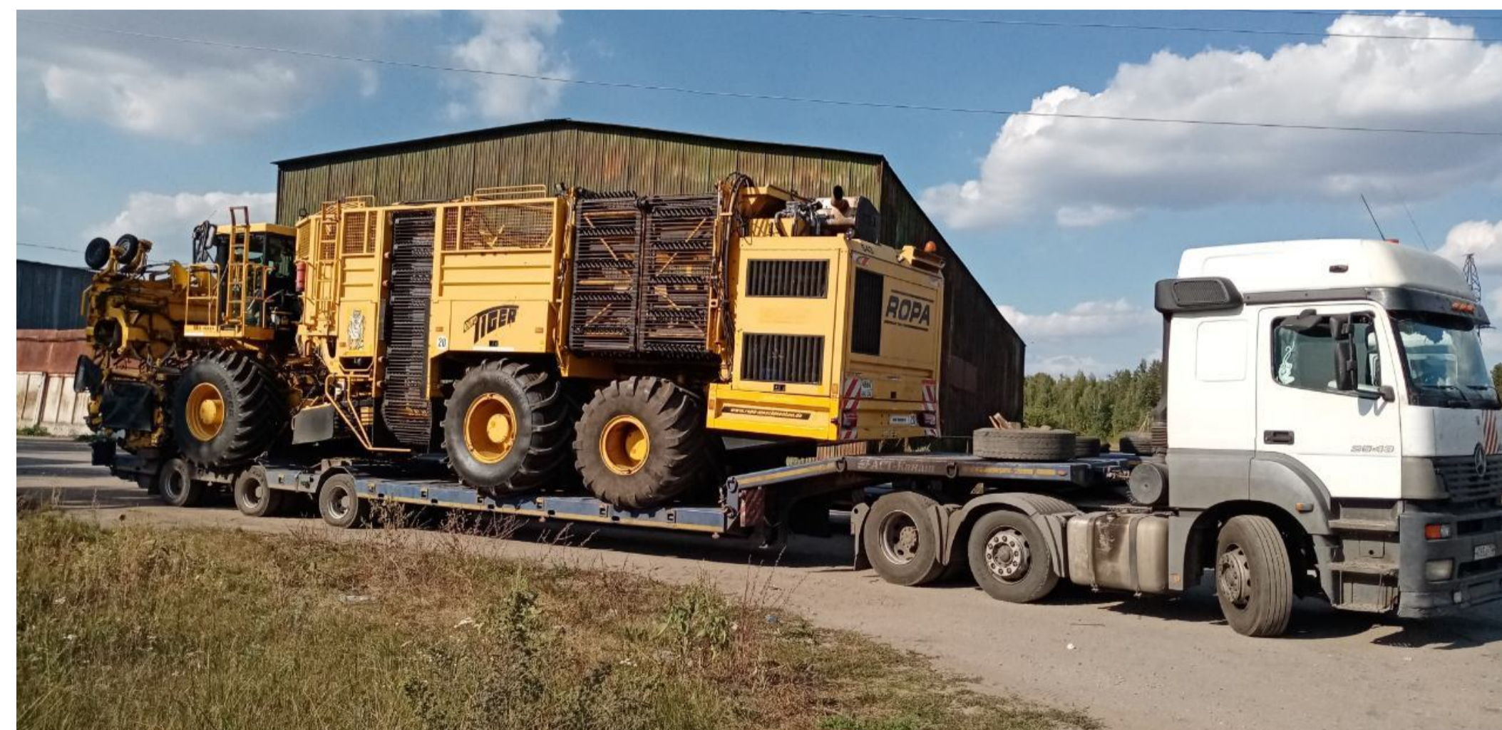
Перевозка свеклоуборочной техники