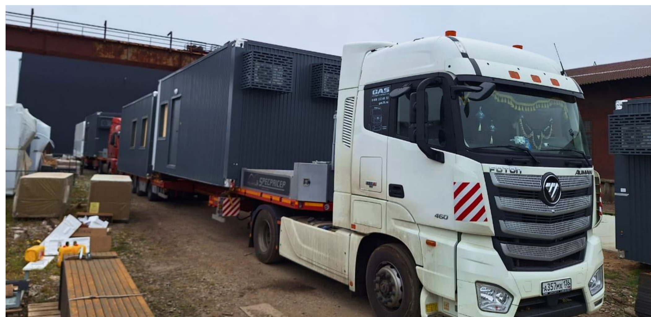
Перевозка модулей с оборудованием общей длиной 19 метров