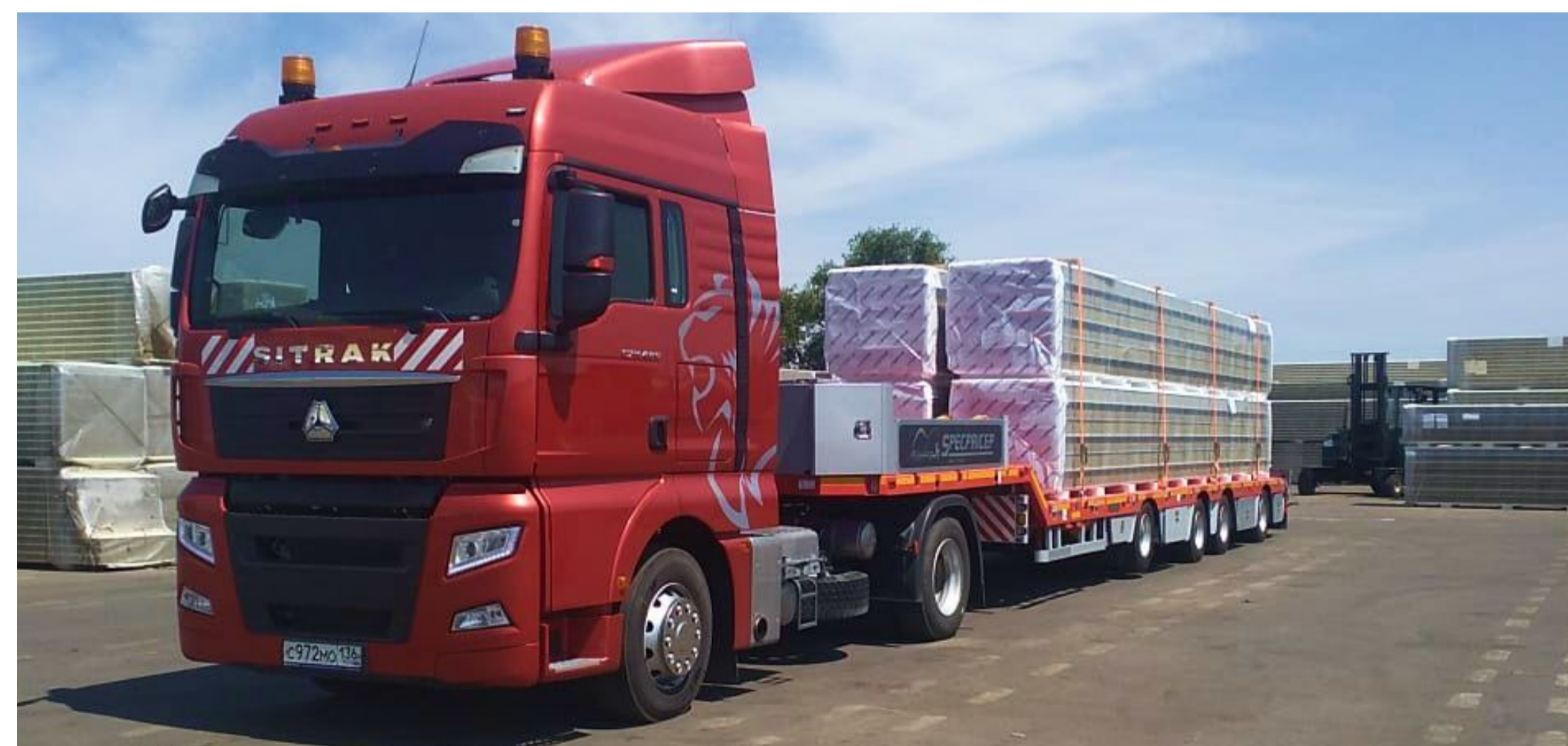
Перевозка строительных материалов