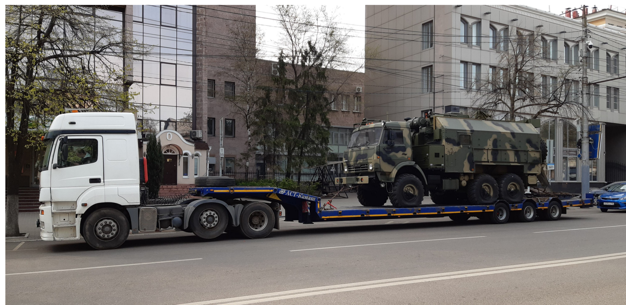
Перевозка изделий на базе КАМАЗа