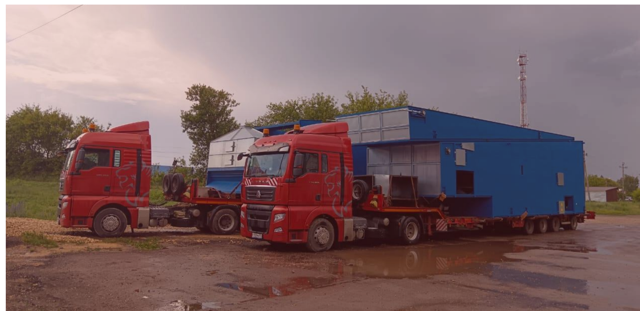
Перевозка зерносушильного оборудования